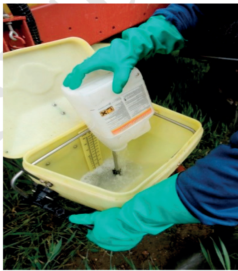
EN SPULEDYSE SIKRER EN NEM OG SIKKER SKYLNING AF TOM EMBALLAGE