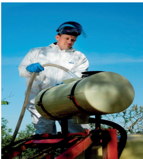
RENTVANDSSTANK EFTERMONTERET PÅ EN MARKSPRØJTE

Rentvandstanken er en vandtank, der indeholder rent vand til indvendig og eventuel udvendig rengøring af en sprøjte. Tanken kan være en integreret del af sprøjtens konstruktion eller være monteret som ekstraudstyr. Rentvandstanken kan også være monteret som fronttank på den traktor, der bærer eller trækker sprøjten. I nogle tilfælde kan det være relevant, at rentvandstanken på anden måde er mobil (afsnit 4.2).