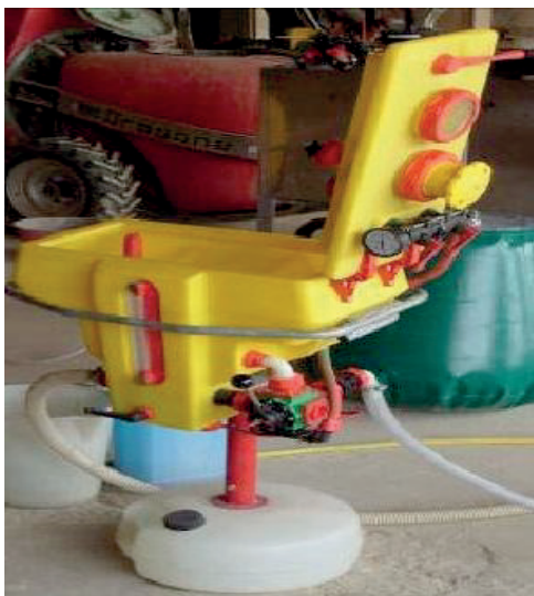
PRÆPARATFYLDEUDSTYR, HVORFRA SPRØJTEMIDLERNE SUGES OP I SPRØJTEN

En tredje løsning kan være montering af udstyret på en mobil enhed. Anvendelse af sugedstyr kombineret med separat skylning på f.eks. vaskepladsen er også acceptabelt. Sugedstyr kan alene anvendes til at fylde flydende plantebeskyttelsesmidler på sprøjten, ikke til granulater.