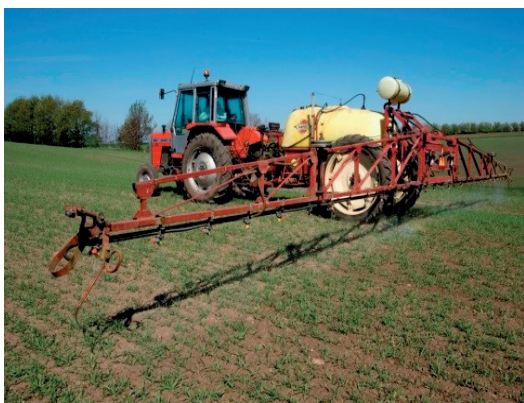
MARKSPRØJTE MED BOM

Bekendtgørelsens definition af marksprøjter omfatter både horisontale marksprøjter med bom, vertikale sprøjter, dvs. tågesprøjter med blæser og ATV-sprøjter. En række specialbyggede sprøjter til forskellige formål er også omfattet. Eksempler på dette kan være tunnelsprøjter, der anvendes i bl.a. jordbær, og båndsprøjter, der kan være monteret på en radrenser eller andre former for redskaber.