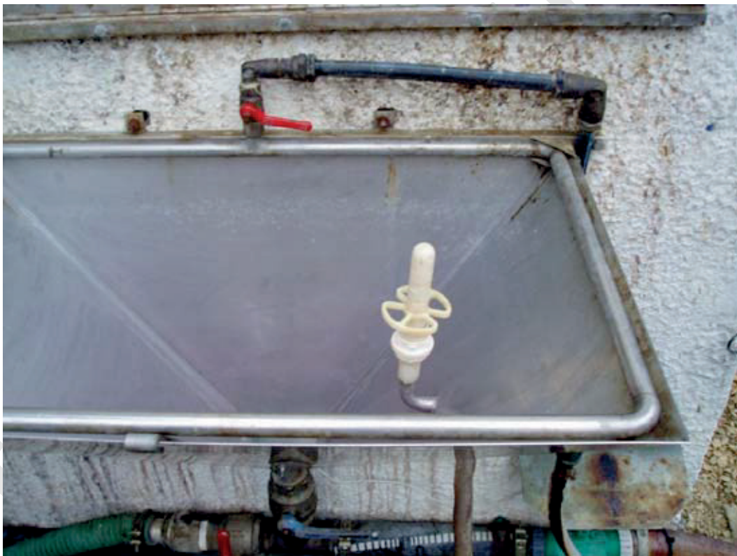
FAST MONTERET PRÆPARATFYLD, HVORFRA SPRØJTEMIDLERNE SUGES OP I SPRØJTETANKEN. ENHEDEN ER UDSITYRET MED SPULEDYSE TIL TOMME DUNKE

På nogle sprøjter - eksempelvis visse tågesprøjter - tillader konstruktionen ikke montering på selve sprøjten. I sådanne tilfælde vil det være muligt at montere præparatfyldestyret fast på vaskepladsen med opsamling af vaskevand eller som en mobil enhed, der kan medbringes ved påfyldning på det areal, der skal behandles.