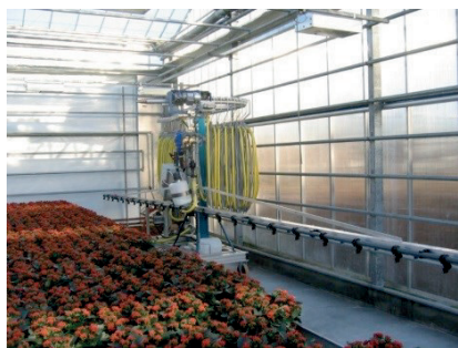
OPHÆNGT VÆKSTHUSSPRØJTE

I væksthuse anvendes flere typer af sprøjter til udbringning af sprøjtemidler. I større væksthuse vil der ofte være ophængte sprøjtebomme, der kan bevæge sig hen over kulturen. Mobile sprøjter med sprøjtelanse eller bom anvendes typisk i mindre væksthuse, men anvendes også i større gartnerier til nogle sprøjteopgaver.