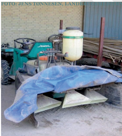
SPECIALSPRØJTE I PLANTESKOLE