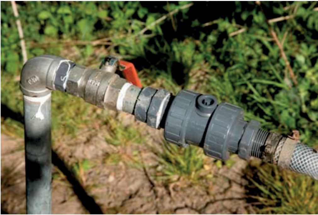
KONTRAVENTIL PÅ TAPSTED ER EN LØSNING TIL AT FORHINDRE TILBAGELØB TIL LEDNINGSNET

Vandpåfyldningsudstyret skal være således indrettet, at vandslangen ikke kan komme i direkte kontakt med væsken i sprøjtebeholderen. Det kan eksempelvis ske ved, at der etableres en rørføring, der gør det muligt at tappe vand direkte ned i sprøjtebeholderen. Er ledningsføringen således indrettet, at vandet med henblik på at undgå skumning ledes ind i bunden af tanken, skal der være etableret hævertbryder, således at der suges luft ind i rør eller slange, så snart vandstrømmen afbrydes.