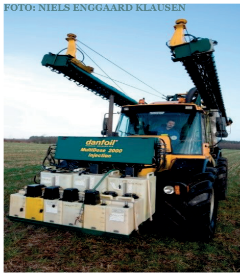
MARKSPRØJTE MED INJEKTIONSSYSTEM