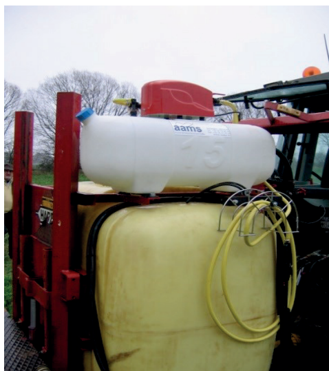
RENGØRINGSSÆT MED RENTVANDSTANK, SPULEDYSE OG RENGØRINGSLANSE TIL EFTERMONTERING