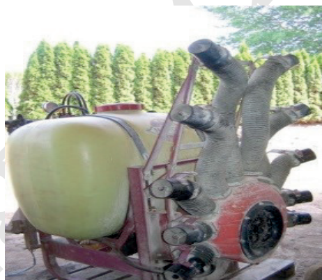
TÅGESPRØJTE MED BLÆSER