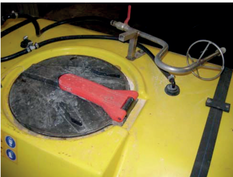
TÅGESPRØJTE MED MONTERING AF DUNK TIL SKYLNING AF TOM EMBALLAGE.