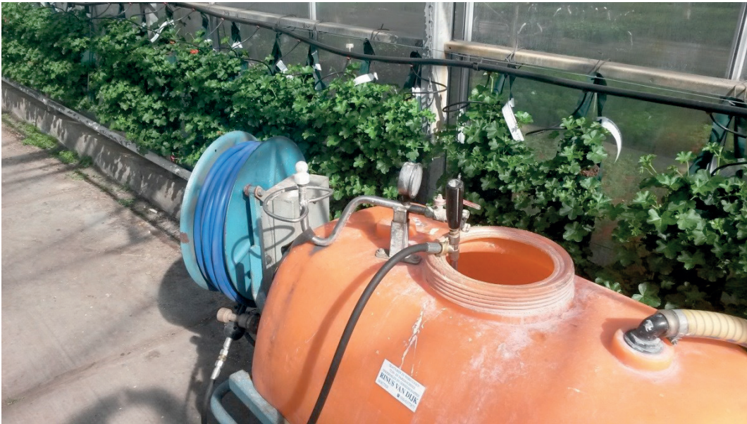
SPRØJTE MED SPULEDYSE TIL AT SKYLLE TOM EMBALLAGE. FOTO: NIELS ENNGAARD KLAUSEN