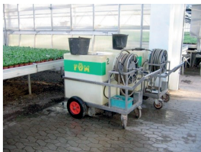
MOBIL VÆKSTHUSSPRØJTE